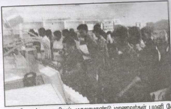
25-07-2018 அன்று இளநிலைத் தாவரவியல் முதலாமாண்டு மாணவர்கள் பழனி வேளாண் மையத்தின் திரவ உயிர் உரம் தயாரிக்கும் பிரிவைப் பார்வையிட்டு, திரவ உயிர் உரம் பற்றி அறிந்தனர்.