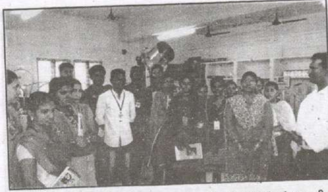
24-07-2018 அன்று முதுநிலைத் தாவரவியல் இரண்டாமாண்டு மாணவர்கள் பழனி வேளாண் மையத்தின் திரவ உயிர் உரம் தயாரிக்கும் பிரிவைப் பார்வையிட்டு, திரவ உயிர் உரம் தயாரித்தல் பற்றி அறிந்தனர்.